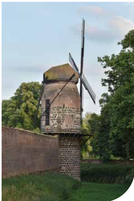
Ein Blick vom Wallgraben auf die Mühle.