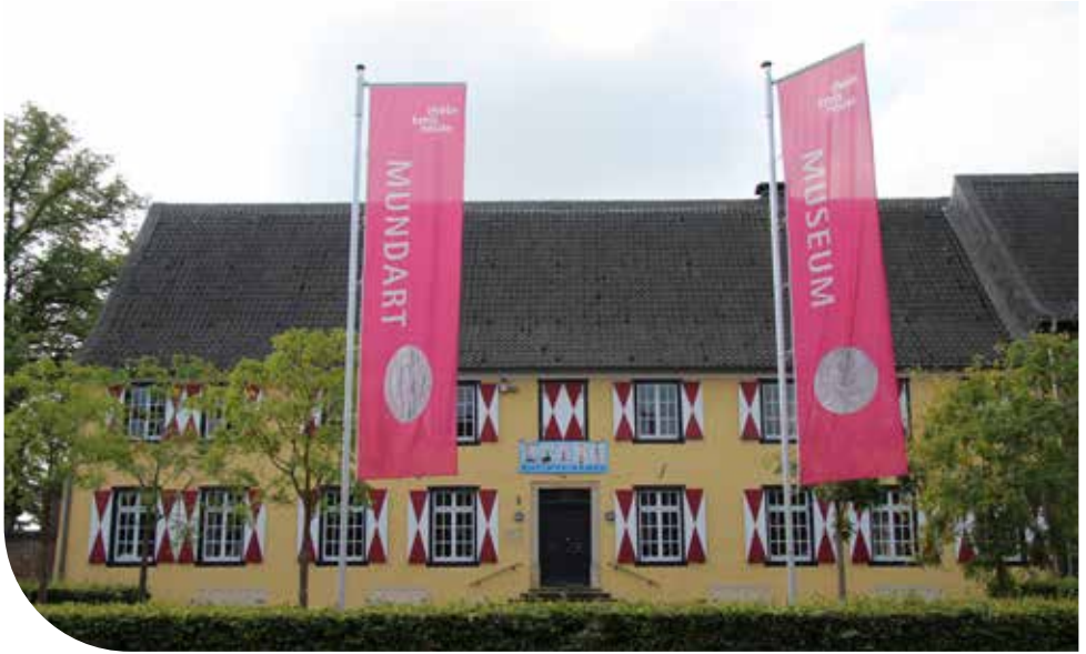
Das Kreismuseum aus Richtung Schloßstraße.