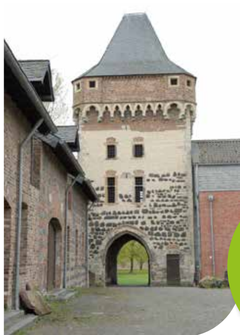
Panorama des Innenhofs mit Torturm.