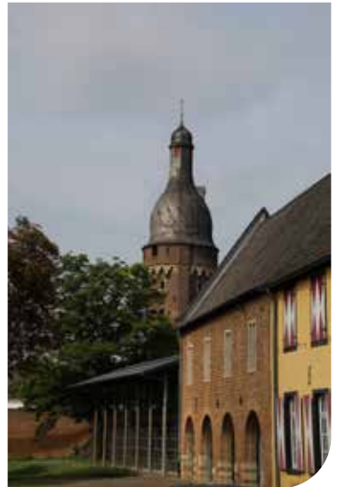
Blick von den Burghöfen; Im Hintergrund der Juddeturm.