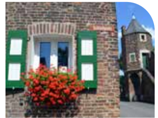
Ecke Schloß- und Rheinstraße, im Hintergrund eine „Pfefferbüchse“.