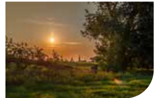
Rheinauen im August.