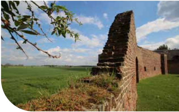
Der Blick über die Stadtmauern hinaus in die Natur.